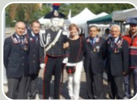
(Festa delle Associazioni Aresine)