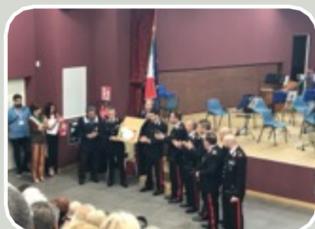
(Il M.Ilo Tora Comandante Stazione CC consegna Targa alla Sezione ANC)