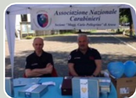
(Raccolta Fondi Telethon)