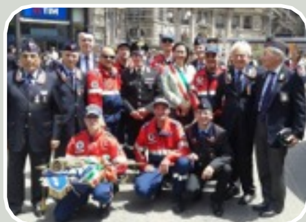
(130° Raduno ANC a Milano)