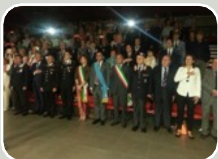
(30° Anniversario ANC Pubblico e Autorità presenti)