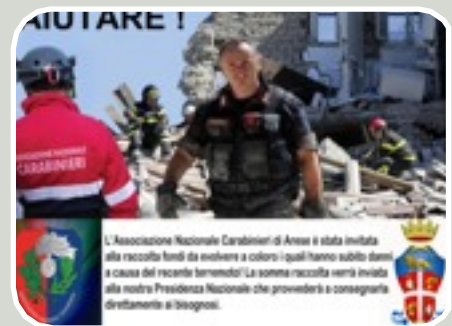
(Presenza ANC zone terremotate)