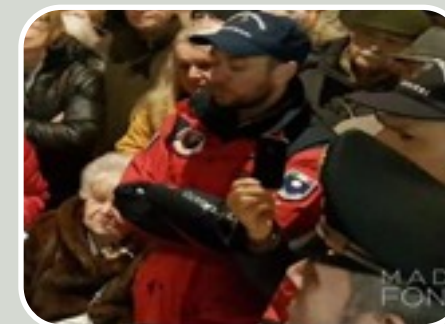
(Presenza Volontari ANC alla inaugurazione Centro Civico Agorà)