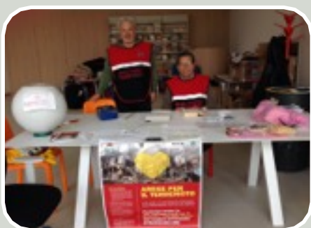
(Raccolta Fondi Sisma dell'Abruzzo)