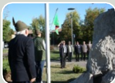
(17° Anniversario Fondazione Alpini di Arese)