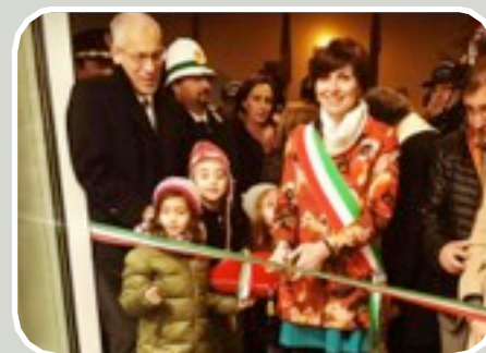
(Inaugurazione Centro Civico Agorà)