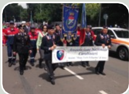
(130° Raduno ANC a Milano)