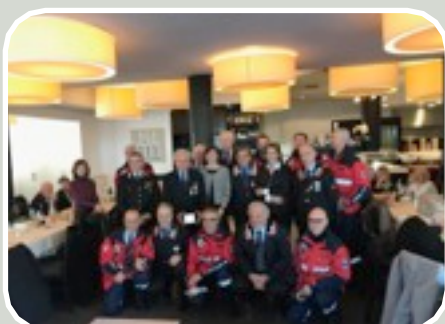
(Festa della Virgo Fidelis e consegna Targa e Pergamena ai Volontari meritevoli)