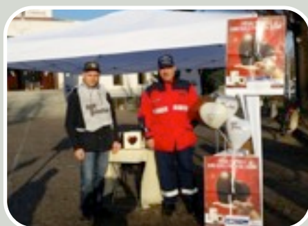
(Raccolta Fondi Telethon)