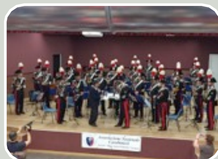
(30° Anniversario ANC di Arese- Consegna Statuina alla Fanfara CC)