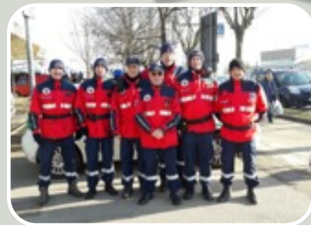
(Il Gruppo Volontari al mercato)