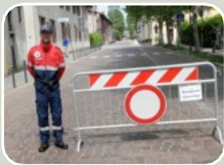
(Servizio Traffico a Valera)