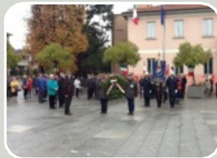
(Ricorrenza del 4 Novembre ai Caduti)