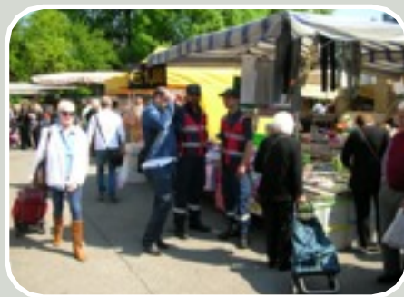
(Sicurezza al mercato)